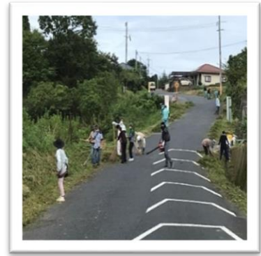
地元の皆さんとの清掃風景です