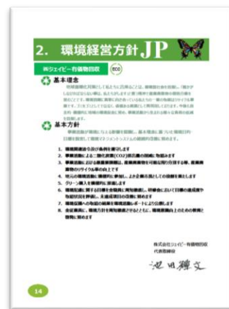
エコアクション21の環境経営方針です