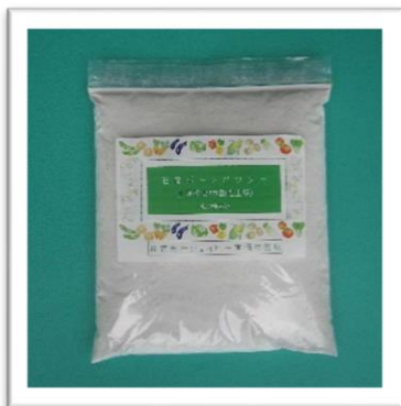
石膏パウダーを 販売しています