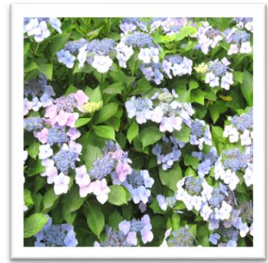
夏頃にはフラワーロードの 紫陽花が綺麗です