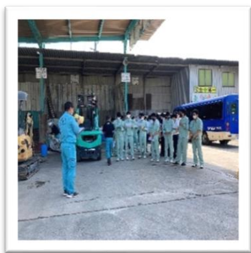
美作高校生の施設見学です