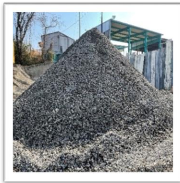
再生骨材（RC40）を 販売しています