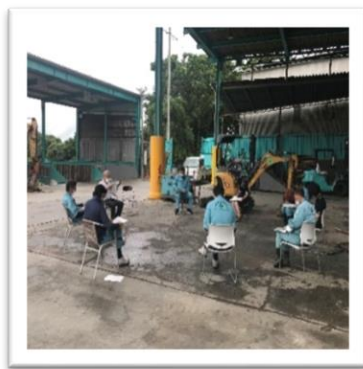
社内ミーティングの様子です