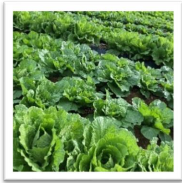
野菜を育てています