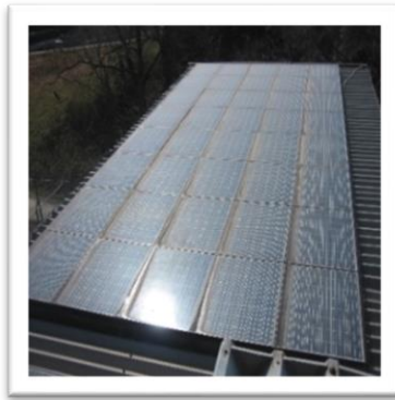
太陽光パネルを事務所の 上に設置しています